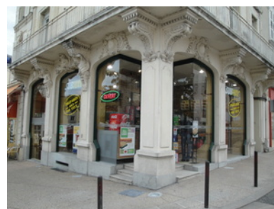
Façade du restaurant SUBWAY® du Mans, Place Roosevelt