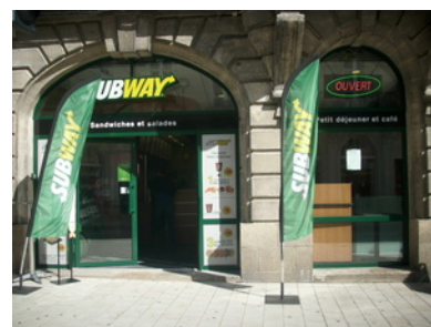
Façade du restaurant SUBWAY® de Vannes, rue Joseph Le Brix