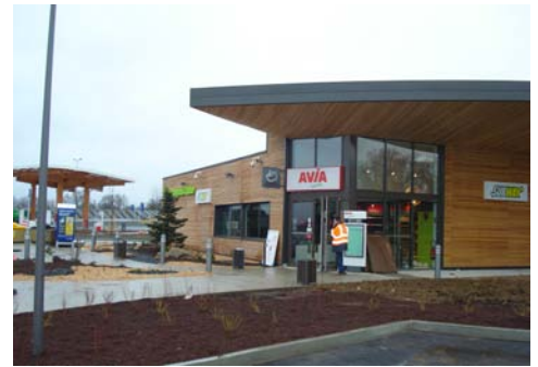
Le restaurant SUBWAY® de Néronde ouvert en février sur l'aire d'autoroute de l'A89

Implantée depuis 2001 en région nord Rhône-Alpes , l'enseigne SUBWAY® compte à ce jour 41 restaurants répartis sur l'ensemble du territoire. Deux établissements ont ouvert leurs portes à Annemasse (74) et sur l'aire d'autoroute A89 à Néronde (42) début 2013, et plusieurs projets sont en cours dont l'ouverture d'un restaurant drive attenant à une station service à Riorges (42) . Pour autant, le marché local est loin d'être saturé : avec quatre départements et des points stratégiques comme Brignais, Beynost et le bassin lémanais, la région regorge d'opportunités pour ceux qui souhaitent lancer leur propre affaire . Avis aux candidats motivés !